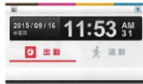
2 ステータスモード [出勤・退勤]