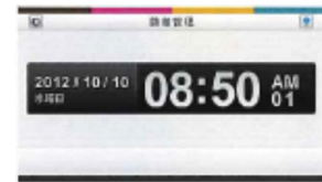
トグルモード サーバでタッチ回数から 出勤ステータスを判断