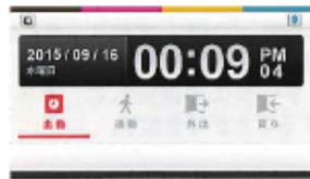
4 ステータスモード [出勤・退勤・外出・戻り] または [出勤・退勤・休憩・戻り]

出勤、退勤等のステータスもタッチパネルで簡単に選択可能です。下記の3モードに加えてボタン名を自由に設定できるカスタマイズモードも設定可能です。